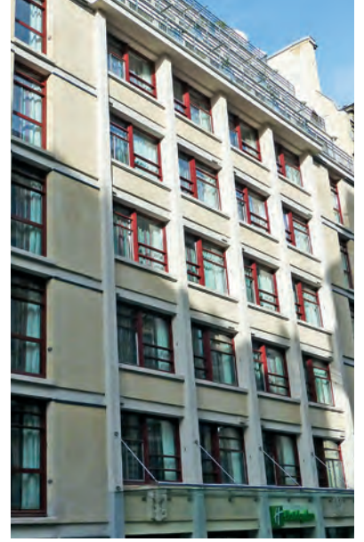
4, rue Danton - Paris 6 e Holiday Inn Paris Notre-Dame - 110 chambres