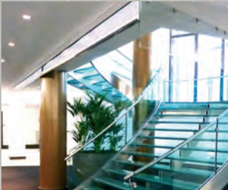
24/26, rue Saint-Dominique Paris 7 e 13 000 m 2 de bureaux loués au Boston Consulting Group