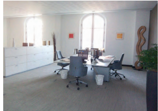
138 bis, rue de Grenelle Paris 7 e 700 m 2 de bureaux loués à la société Winamax