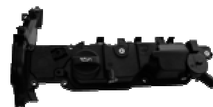
Connecteur pour circuits carburant