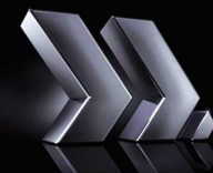
TABLEAU DES FLUX DE TRESORERIE CONSOLIDES