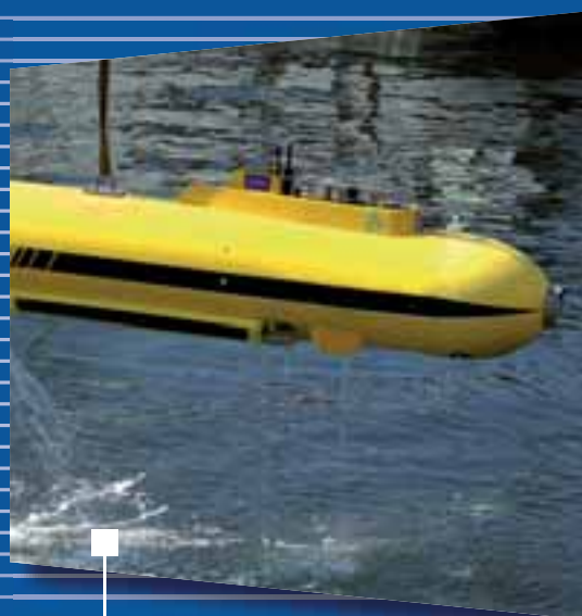
Systemes Intelligents de Sûreté