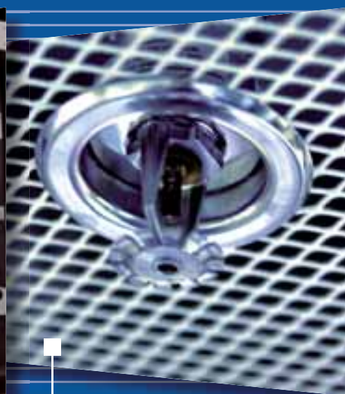
Projets et Services Industriels