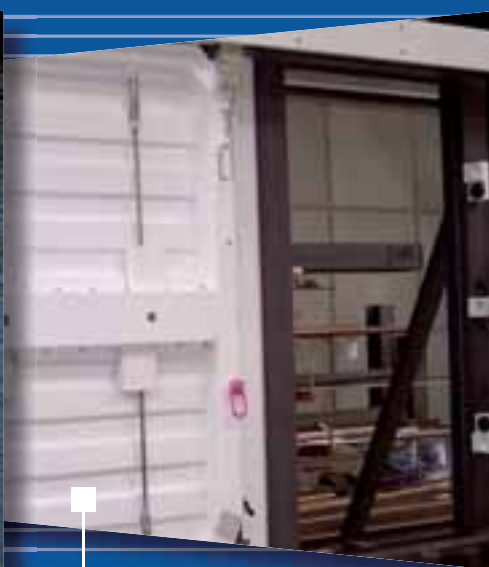
Protection en Milieux Nucléaires