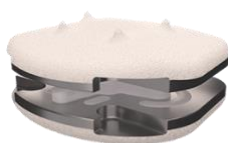
Prothèse cervicale CP-ESP

Les prothèses discales CP-ESP et LP-ESP font partie des solutions de préservation du mouvement les plus fiables et les plus largement implantées en Australie, offrant des performances biomécaniques avancées et des résultats cliniques à long terme. Leur ajout complètera le portefeuille croissant de dispositifs de fusion proposés par Evolution Surgical.