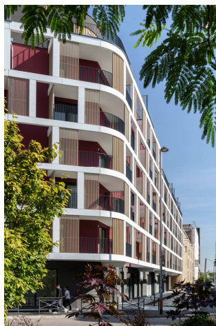
Résidence Renaissance à Metz (57) inaugurée en Octobre 2024

Nous avons inauguré en Octobre dernier, la résidence Renaissance composée de 118 lots, au 70 rue des Arènes à Metz (57), et y avons installé notre agence locale sur 295 m 2 .