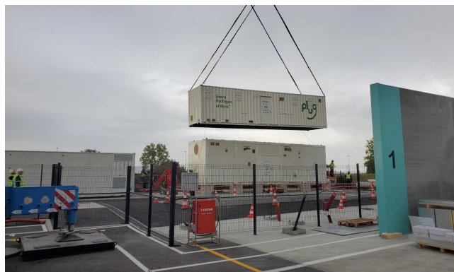
Site de Croixrault, Hauts-de-France, France

mobilité et d'industrie. Il a obtenu en mai 2025 une subvention à hauteur de 2,5 M€ de la part de la Région Hauts-de-France.