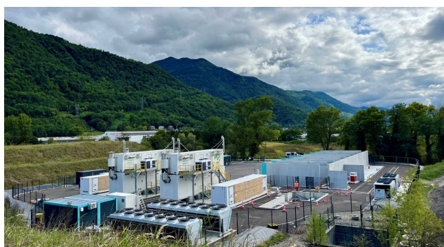
Site de Le Cheylas, Isère, France

Au Cheylas, entre Grenoble et Chambéry, Lhyfe construit un site de production d'hydrogène vert d'une capacité d'électrolyse de 10 MW. La plupart des équipements (électrolyseurs, système de refroidissement, transformateur) ont été reçus sur site et sont en cours d'installation. Les prochaines étapes incluent l'infrastructure électrique et la tuyauterie. Pour ce projet, Lhyfe a reçu une subvention de 5,5 M€.