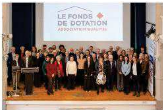
Les Lauréats du Fonds de dotation QUALITEL 2025

L'ensemble de ces associations, récompensées à l'occasion de cette édition 2025, se partagent près de 200 000€, destinés à les aider à démarrer leur projet, le faire évoluer et surtout le concrétiser. Un coup de pouce précieux pour ces hommes et ces femmes qui se mobilisent chaque jour aux côtés des personnes défavorisées ou isolées. Un engagement fondamental, depuis près de 15 ans, pour le Fonds de dotation QUALITEL.