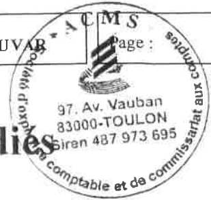
Tableau de suivi des fonds dédiés