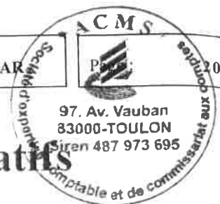
Tableau de suivi des fonds associatifs